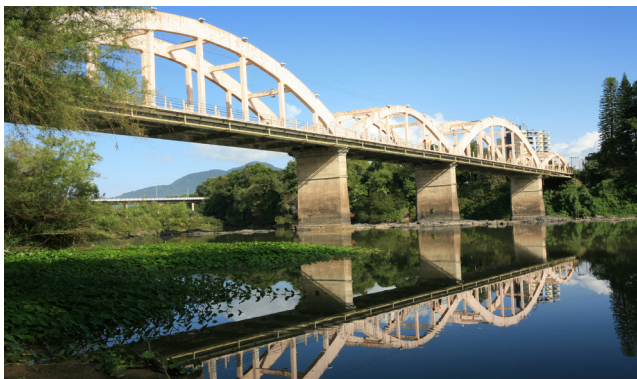
FOTO: Ponte dos Arcos